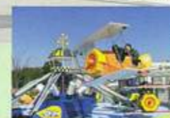
▲大型遊具で大人も子どもも楽しめる!