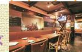
▲カジュアルな雰囲気の店内には和洋の個室も備えている

●刈谷市桜町1-50-2●JR・名鉄刈谷駅から徒歩1分●11時～13時30分、17時30分～23時(金・土曜は～24時)●不定休●なし