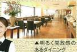
▲明るく開放感のあるダイニング

●知立市中町中128ホテルクラウンパレス知立10階●名鉄知立駅から徒歩3分●6時30分～10時、11時30分～14時30分、18時～21時30分(日曜、祝日の夜は～21時)●無休●共同駐車場利用