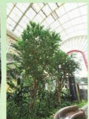
▲開放的なアトリウムは市民の憩いの場 ◀健康をテーマにしたコミュニティスポット