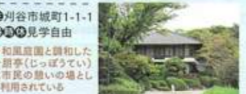
▲和風庭園と調和した十層塔(じっぽうたい)は市民の憩いの場として利用されている

●かりやじょうし ☎0566-62-1037 (刈谷市文化観光課) 天文2年(1533)に水野忠政が築城。9家22人の譜代大名が城主となった。現在、一帯は亀城公園となっている。