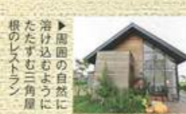
▲周囲の自然に溶け込むように建てられたレストラン

東京で17年間フランス料理のシェフを勤めたオーナーが腕をふるう店。ランチのハンバーグやカレーには三河野菜や地元素材を使い、本格的な味を楽しめる。