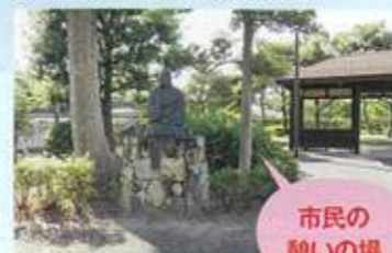
▲住宅街にひっそりと於大が残る

●しいのきやしきあと ☎0566-62-1037 (刈谷市文化観光課) 江戸時代には一般に出入りが禁止され、出入口に鍵がかかっていた。於大の方が岡崎から刈谷に戻された際、一時住んでいたといわれる。