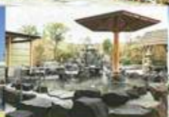
▲天然温泉かきつばたの湯船でリフレッシュ