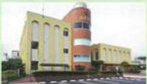
▲開放的なアトリウムは市民の憩いの場 ◀健康をテーマにしたコミュニティスポット