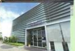
▲刈谷の観光をPRするオアシス館刈谷INFOBOX